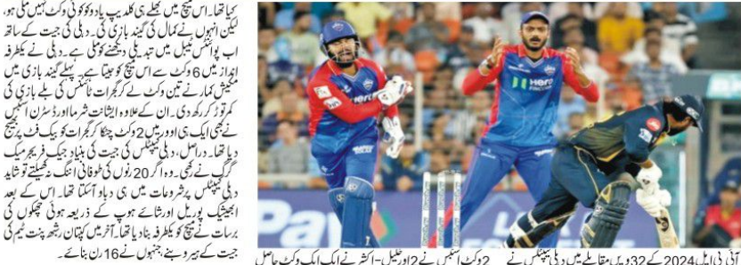
آئی بی ایل 2024 کے 32 واں میچ میں، دہلی ٹیم نے گجرات ٹیم کو 6 وکٹوں سے زبردست شکست دی۔ دہلی کی یہ اس میچ کی دوسری جیت ہے۔ دہلی کی جیت کے ساتھ ہی اب گجرات کی ٹیموں پر پلے آف سے باہر ہونے کا خطرہ منڈلا لیا ہے۔ اس جیت کے ساتھ ہی گجرات ٹیموں کی پریشانی میں اضافہ ہوا ہے۔ گجرات کے خلاف دہلی کی شاندار گیند بازی پر گجرات ٹیم کے کپتان کی ٹیم سے یہ جیت دہلی کے لیے بھاری ہونے والی ہے۔