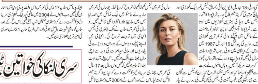
روسی ٹینس خاتون کھلاڑی شاراپووا 18 برس کی عمر میں پہلی بار عالمی چیمپئن بنیں۔