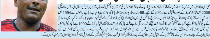
برازیلیئن قد آور و مارو 58 سال کی عمر میں پروفیشنل فٹ بال میں واپسی کریں گے۔