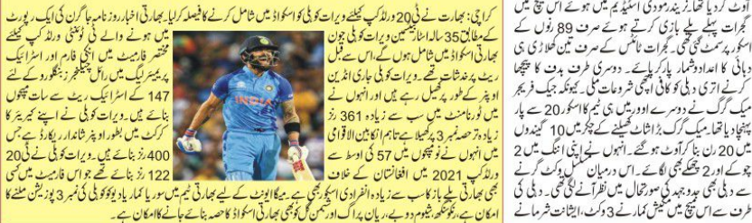
بھارت نے ٹی 20 ورلڈ کپ کے لیے اسکوڈ میں شامل کرنے کا فیصلہ کر لیا ہے۔ بھارتی ٹیم کے کپتان کوئی کو بھارتی اسکوڈ میں شامل کرنے کا فیصلہ کر لیا ہے۔