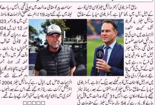
سابق آسٹریلوی کرکٹر مائیکل سیلڈر کو جیل منتقل کر دیا گیا ہے۔