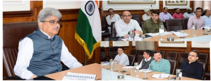
چیف سیکرٹری نے ای آر اے کے تحت جاری پروجیکٹوں پر پیش رفت کا جائزہ لیا۔

جسٹس کی زیر سربراہی ای آر اے کے چیف سیکرٹری نے ای آر اے کے تحت جاری پروجیکٹوں پر پیش رفت کا جائزہ لیا۔ چیف سیکرٹری نے ای آر اے کے چیف سیکرٹری کے ہمراہ ای آر اے کے چیف سیکرٹری کے دفتر میں ایک میٹنگ منعقد کی۔ چیف سیکرٹری نے ای آر اے کے چیف سیکرٹری کے ہمراہ ای آر اے کے چیف سیکرٹری کے دفتر میں ایک میٹنگ منعقد کی۔ چیف سیکرٹری نے ای آر اے کے چیف سیکرٹری کے ہمراہ ای آر اے کے چیف سیکرٹری کے دفتر میں ایک میٹنگ منعقد کی۔