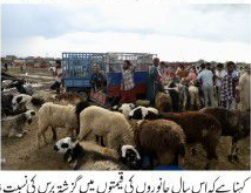
عید الاضحیٰ کی آمد کے ساتھ کشمیر بھر میں مویشی منڈیوں میں گہما گہمی۔

سری نگر، 4 جون (این آئی)۔ عید الاضحیٰ کی آمد سے قبل قیدیوں کی ضمانت کے لیے تمام ریاستوں اور مرکز کے زیر انتظام علاقوں کو یاد دہانی دے دی گئی ہے۔ وزارت داخلہ نے اسٹیٹیم کے تحت مئی 2023 میں متعارف اسٹیٹیم کا مجموعی طور پر نافذ نہ ہونے پر حوصلہ افزا نہیں دیا۔ وزارت داخلہ نے اسٹیٹیم کے تحت مئی 2023 میں متعارف اسٹیٹیم کا مجموعی طور پر نافذ نہ ہونے پر حوصلہ افزا نہیں دیا۔