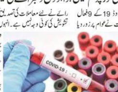
کووڈ 19 کی تشخیص کے لیے ٹیسٹ کیا گیا۔

سری نگر، 4 جون (این آئی)۔ سری نگر/او ڈی ایم کشمیر میں کووڈ 19 کے 9 فعال معاملات درج، کشمیر میں پانچ اور جموں میں چار کیس۔ وزارت داخلہ نے اسٹیٹیم کے تحت مئی 2023 میں متعارف اسٹیٹیم کا مجموعی طور پر نافذ نہ ہونے پر حوصلہ افزا نہیں دیا۔ وزارت داخلہ نے اسٹیٹیم کے تحت مئی 2023 میں متعارف اسٹیٹیم کا مجموعی طور پر نافذ نہ ہونے پر حوصلہ افزا نہیں دیا۔