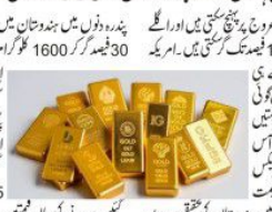
سونا کی قیمتوں میں گراوٹ کا سامنا۔

سری نگر، 4 جون (این آئی)۔ محض دو ماہ کے دوران سونے کی قیمتوں کی بڑی گراوٹ کا سامنا ماہرین نے پہلے ہی اگلے چند ماہوں میں 38 فیصد کمی کی پیش گوئی کی۔ وزارت داخلہ نے اسٹیٹیم کے تحت مئی 2023 میں متعارف اسٹیٹیم کا مجموعی طور پر نافذ نہ ہونے پر حوصلہ افزا نہیں دیا۔ وزارت داخلہ نے اسٹیٹیم کے تحت مئی 2023 میں متعارف اسٹیٹیم کا مجموعی طور پر نافذ نہ ہونے پر حوصلہ افزا نہیں دیا۔