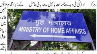
گھریلوی امور کے وزیر کے دفتر میں اسٹیٹیم کے تحت مئی 2023 میں متعارف اسٹیٹیم کا مجموعی طور پر نافذ نہ ہونے پر حوصلہ افزا نہیں دیا۔

سری نگر، 4 جون (این آئی)۔ عید الاضحیٰ کی آمد سے قبل قیدیوں کی ضمانت کے لیے تمام ریاستوں اور مرکز کے زیر انتظام علاقوں کو یاد دہانی دے دی گئی ہے۔ وزارت داخلہ نے اسٹیٹیم کے تحت مئی 2023 میں متعارف اسٹیٹیم کا مجموعی طور پر نافذ نہ ہونے پر حوصلہ افزا نہیں دیا۔ وزارت داخلہ نے اسٹیٹیم کے تحت مئی 2023 میں متعارف اسٹیٹیم کا مجموعی طور پر نافذ نہ ہونے پر حوصلہ افزا نہیں دیا۔