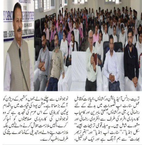
سرگرمی/02 اگست/ مشن یوولڈ نے جموں و کشمیر بھر میں "انٹرنیٹ پر میڈیا سہولت سازی" کا آغاز کیا۔