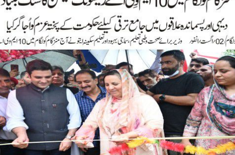
وزیر برصغرت صحت و طبی تعلیم سماجی بہبود اور تعلیم سکینہ ایتونے رکھا۔

وزیر برصغرت صحت و طبی تعلیم سماجی بہبود اور تعلیم سکینہ ایتونے رکھا۔ وزیر برصغرت صحت و طبی تعلیم سماجی بہبود اور تعلیم سکینہ ایتونے رکھا۔