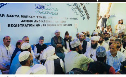
مذہب اور سائنس کے درمیان میں مذہبی سائنسی تعلیمی کے امتحان پر زور دیا۔

مذہب اور سائنس کے درمیان میں مذہبی سائنسی تعلیمی کے امتحان پر زور دیا۔ وزیر اور رکن پارلیمنٹ نے مدراس میں مذہبی سائنسی تعلیمی کے امتحان پر زور دیا۔ وزیر اور رکن پارلیمنٹ نے مدراس میں مذہبی سائنسی تعلیمی کے امتحان پر زور دیا۔