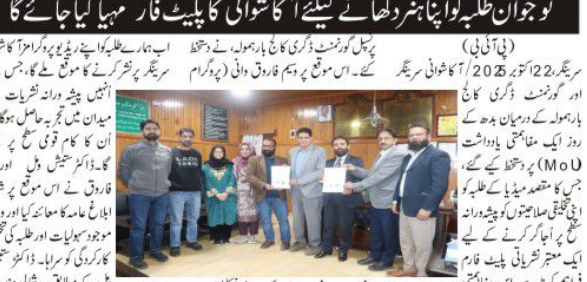
آکاشوانی سرینگر اور گورنمنٹ ڈگری کالج بارہمولہ کے درمیان مفاہمت نوجوان طلبہ کو اپنا ہنر دکھانے کیلئے آکاشوانی کالج میں مہیا کیا جائے گا۔

آکاشوانی سرینگر اور گورنمنٹ ڈگری کالج بارہمولہ کے درمیان مفاہمت نوجوان طلبہ کو اپنا ہنر دکھانے کیلئے آکاشوانی کالج میں مہیا کیا جائے گا۔ اس موقع پر ہمہ فائق و قابل (پروگرام) کے سربراہان نے ایک وفد کے ساتھ ملاقات کی اور ان کے ساتھ ساتھ دیگر افسران اور جوائنٹ سروس کمانڈر جنرل ایچ ڈی ایچ جی کے ساتھ ملاقات کی۔